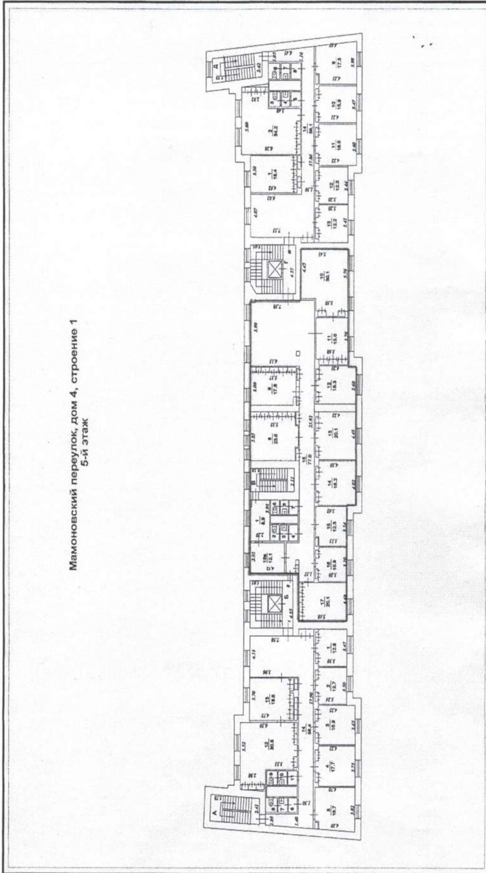
Мамоновский переулок, дом 4, строение 1 5-й этаж